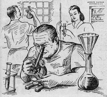
APOLLO NATHAN DISTRIBUIDOR S. A.